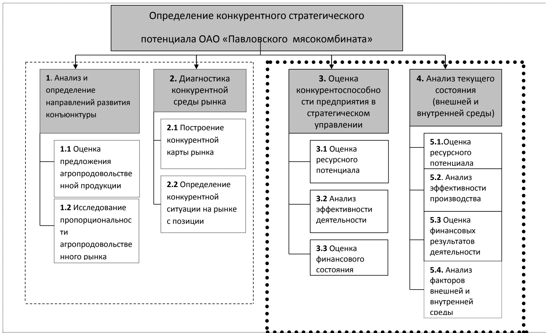
Рисунок 2.1 - Алгоритм определения стратегического конкурентного потенциала ОАО «Павловского мясокомбината»