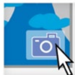
Нажать на картинке правой кнопкой мыши

Исследуйте пять книг о данной планете, которые можно бесплатно почитать в Интернете и приведите список использованной литературы в презентации.