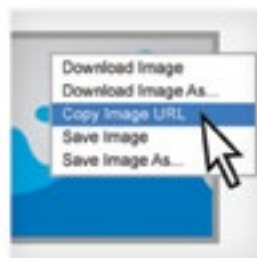
Вставить ссылку на изображение