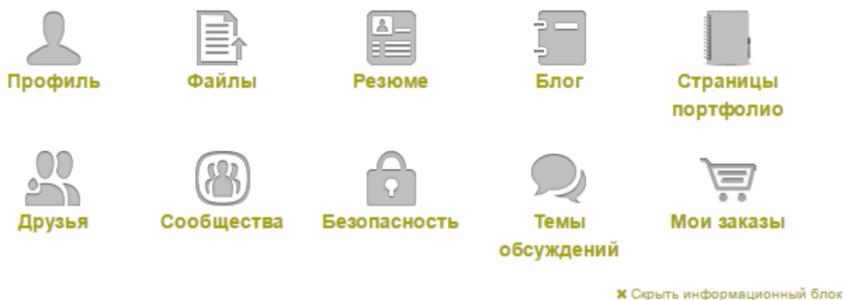
Рисунок 2.3: Кнопки быстрого доступа в 4Портфолио

Когда вы первый раз зайдете в систему, вы увидите кнопки быстрого доступа. С помощью этих кнопок вы сможете быстро перейти на нужную страницу портала прямо из панели управления.