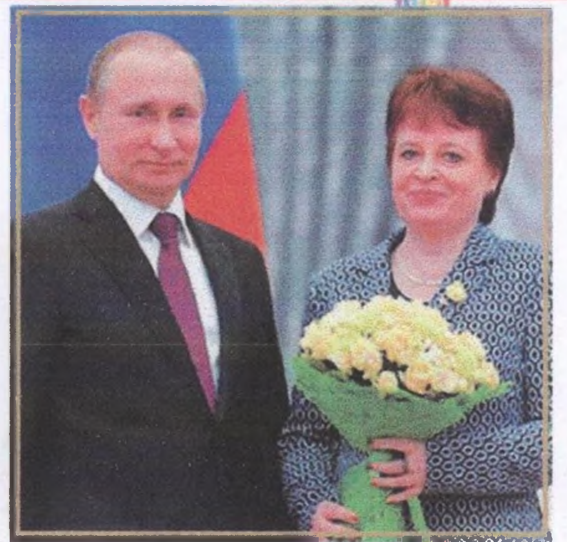
Е.В. Нечитайлова на встрече с Президентом Российской Федерации В.В. Путиным